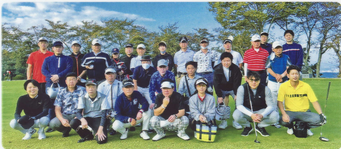
互助会ゴルフコンペ参加者の皆様