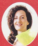
ユスティナ・スワヴィエツ=コジエニ (ソプラノ)