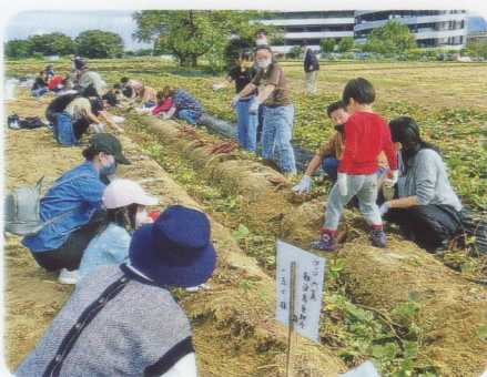
みんなで「掘ったよ」

10月23日(日)秋晴れの下、寝屋観光農園において48名の参加を得て芋掘り体験を開催いたしました。毎年美味しいと好評で、焼き芋、スイートポテト、大学芋などの料理に楽しんでいただけたと思います。