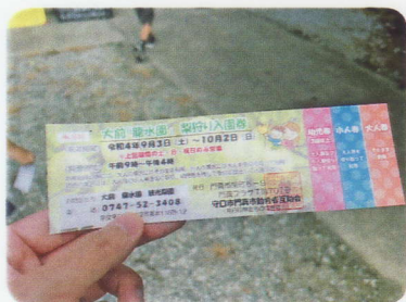
チケットを持って