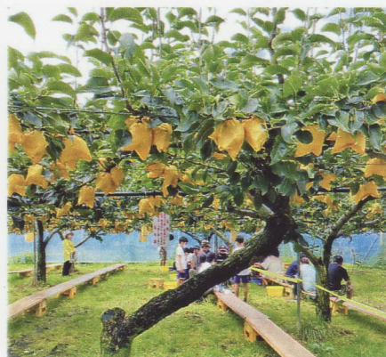
頑張って梨を摘ぐぞ

今回はイベントとして「梨狩り」に参加しました。 場所は奈良吉野にある龍水園さん、とっても自然豊かな場所ですが、以外と近く大阪からは高速で1時間以内で来れちゃいます。コロナの関係で、互助会関係のお客様のみで、とっても空いていて尚よし。