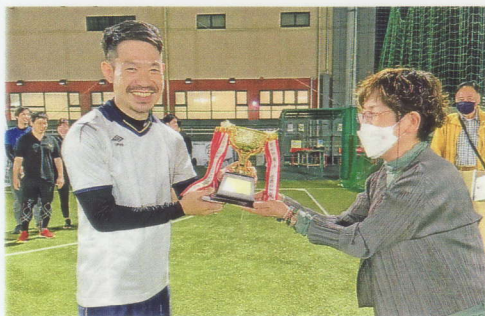
雑賀副会長による表彰式